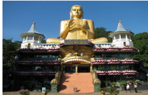
Golden Temple of Dambull