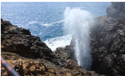
Hummanaya blow hole