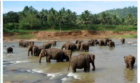
Pinnawala Elephant Orphanage