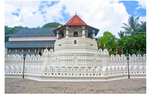
Temple of the Sacred Tooth Relic