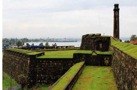
Gardens i Galle Fort